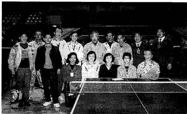
昆明選手とともに

藤沢、昆明両市卓球協会交流の種は時かれましたが、芽を出し大きな花を咲かせるため、今後も卓球愛好者の皆さんとともに努力したいと思います。