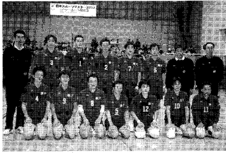
藤沢マスターズの選手のみなさん

藤沢市に於いて十一月にバドミントン、バレーボール、サッカーの三競技が開催され、往年の名選手達が藤沢に集まり激しい試合と交歓会で素晴らしい大会になりました。同時にスポーツ教室も開かれました。 (バレーボール競技男子の部) 大会は11月9日から12日まで4日間秋葉台文化体育館と秩父宮記念体育館で行われ、藤沢マスターズが出場、9日の予選リーグを勝ち進み、決勝トーナメントでは5位という輝かしい成績を収めることができました。 この大会は40歳以上による壮年の国体で往年の名選手が一堂に会して和やかな中にも激しい試合が展開されました。選手の皆さんお疲れ様でした。