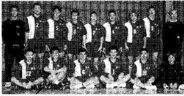
県総体優勝 バレーボール男子

来年も連覇が続けられるようにバレーボール協会あげて頑張りますので皆様のご声援とご協力を切にお願い申し上げます。