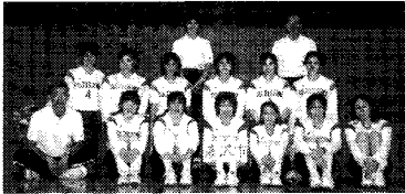
県総体バレーボール女子「優勝おめでとう」