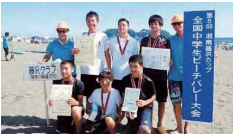
男子の部 準優勝 藤沢クラブ

男子は藤沢クラブが地の利を生かし、準決勝で羽咋中学に(25-11)で勝ち、決勝戦に進出し2度目の優勝が期待されましたが、大和ユウ(広島県)に(18-25)で敗れ準優勝となりました。 今大会には新たに、宮城県、長野県、滋賀県、香川県の参加があり、特に長野県の姉妹都市、松本市から初参加の菅野中学(3位)は優勝した明治チームと大接戦を展開し、応援の保護者や役員席からも拍手をいただきました。 年々参加チームが増えてくる、「湘南藤沢カップ全国中学生ビーチバレー大会」は、さらなる発展が期待されたいでしょう。