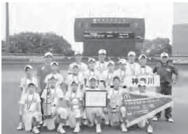
六会レッズ 選手・役員の皆さん

その翌日に、準決勝戦で、愛媛県代表の優勝したチームに敗れたものの、全国で約15,000チームある中で、堂々の全国3位で大会を終えました。