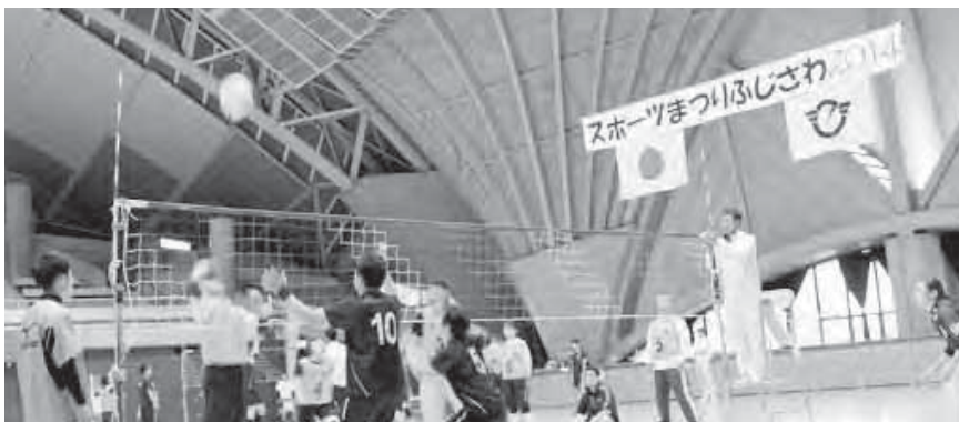
ソフトバレー試合中の様子

各グループの決勝トーナメント戦は、同レベルの試合で競技的スポーツと、生涯(レク)スポーツと形の違った接戦が続いていました。表彰式では、入賞チーム