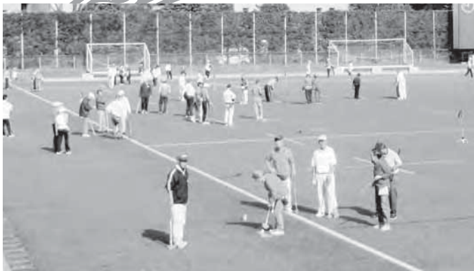
グラウンドゴルフを楽しむ皆さん

ともにボールが良く転がるようになったりとプレーヤーは時間の変化する芝の状態を読みながら好スコアを出すべくプレーに打ち込んでいました。一般参加の方も各組のリーダーの助言を聞きつつ、比較的順調な運営進行となりました。