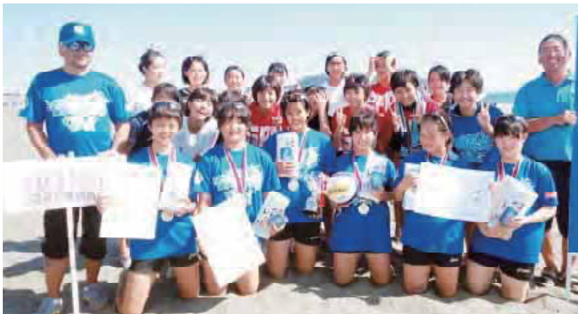
女子の部 優勝 明治中学校 3連覇

2日目は、前日の湘南の風もおさまり、絶好のコンディションの中で決勝トーナメント戦が行われ、予選リーグ1位の、明治(女子)は準決勝で菅野中学(長野県)に(25-13)で勝ち、決勝戦では大東門真(大阪府)に(25-19)勝利し3連覇を成し遂げました。