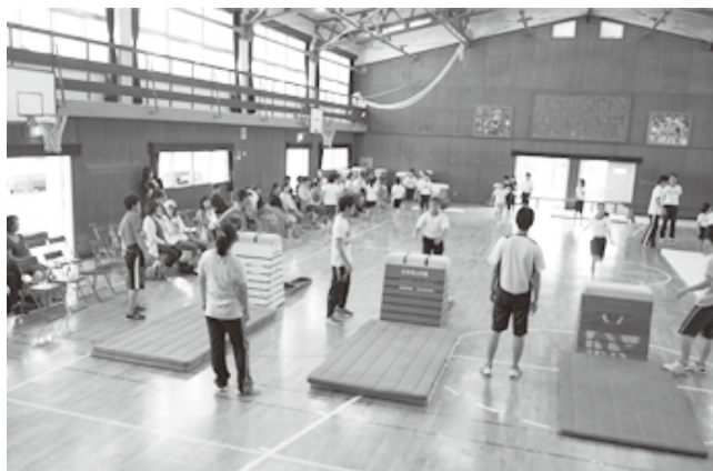
楽しく安全に跳び箱体験中!