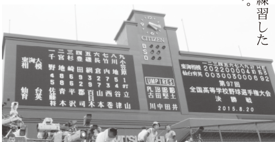
第97回選手権大会決勝