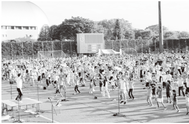
皆で楽しくラジオ体操