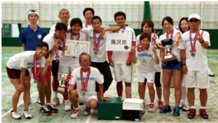
全日本都市対抗テニス大会準優勝

昨年の和歌山市での同大会準々決勝で苦杯をなめた、神戸市とは最終戦の男子シングルスに懸かる接戦でしたが4-3で辛勝、決勝はここまで1ポイントを落しただけと快進撃の京都市です。「あとひとつ」とチーム一丸、心をひとつ